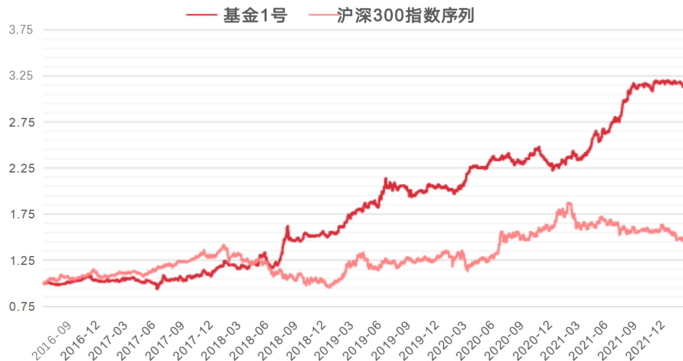
某基金1号净值走势图

历史业绩仅供参考，不预示其未来表现，基金管理人管理的其他基金的业绩并不构成基金业绩表现的保证